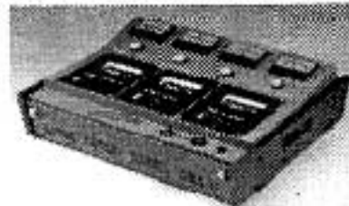
OTARI社のDP-33（写真左）とDP-4050F（写真右）